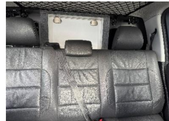
Gepäckbox, alternativ Sitzbank hinten Lehne klappbar